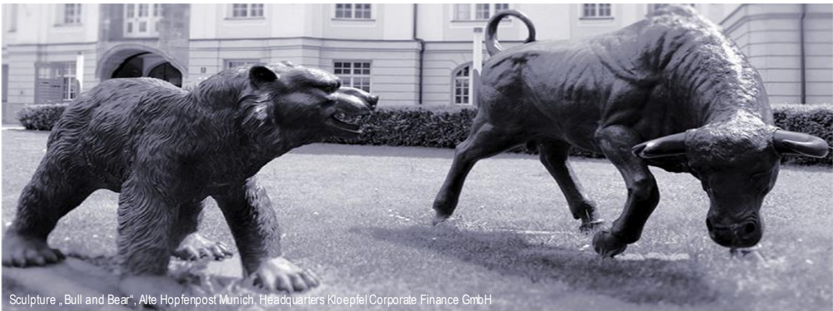
Sculpture „Bull and Bear“, Alte Hopfenpost Munich, Headquarters Kloepfel Corporate Finance GmbH