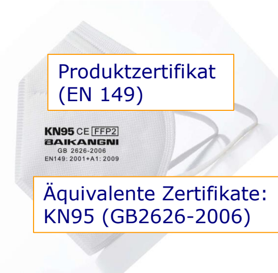
Produktzertifikat (EN 149)