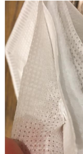
Material Aufbau und Qualität