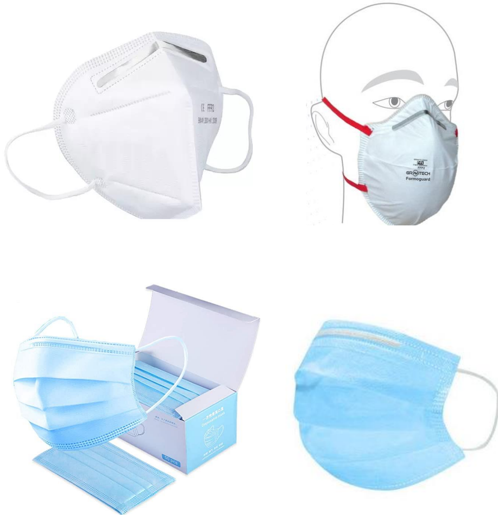
Nur illustratives Beispiel